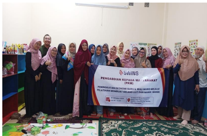
Gambar 4. Kegiatan Penutup Peningkatan Ekonomi Guru & Wali Murid Melalui Pelatihan

Selain itu, kegiatan ini turut memperkuat hubungan kolaboratif antara pihak sekolah, dosen, dan masyarakat melalui aktivitas edukatif yang produktif dan inspiratif. Pelaksanaan program ini membuktikan bahwa pelatihan berbasis keterampilan dapat menjadi alternatif strategis dalam pemberdayaan ekonomi keluarga di lingkungan sekolah. Dengan dukungan yang berkelanjutan, kegiatan serupa berpotensi dikembangkan sebagai program unggulan yang dapat diterapkan di berbagai lembaga pendidikan lainnya.