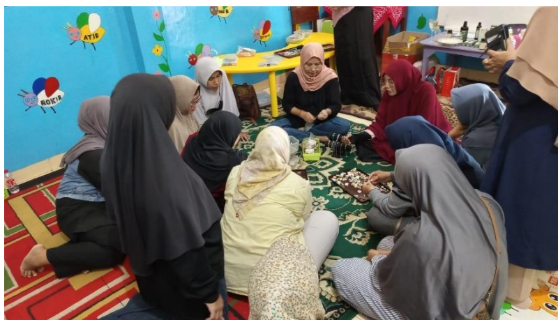
Gambar 2. Praktik Pembuatan Gelang

beberapa peserta mencoba memadukan warna-warna unik, sementara yang lain bereksperimen dengan kombinasi batu alam dan kaca. Di akhir sesi, seluruh peserta berhasil menghasilkan minimal satu gelang lilit dengan kualitas yang cukup baik.