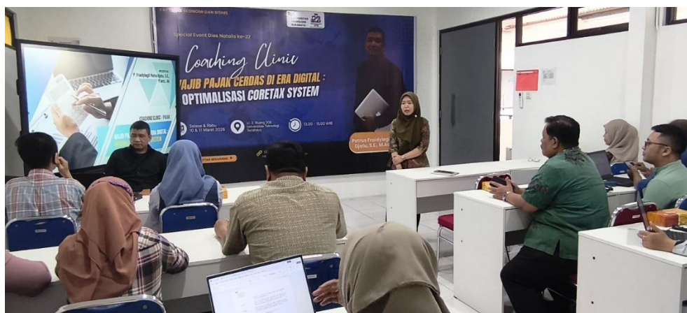
Gambar 2. Sosialisasi dan pelatihan coretax

Pada hari pertama, kegiatan dibuka dengan sesi sosialisasi konseptual mengenai kebijakan implementasi Coretax System oleh narasumber. Narasumber memaparkan latar belakang lahirnya Coretax System sebagai bagian dari program reformasi perpajakan DJP, fitur-fitur unggulan sistem, serta kewajiban dan hak wajib pajak dalam ekosistem digital baru ini. Sesi ini berlangsung dari pukul 13.00 hingga 15.00 WIB dan diakhiri dengan tanya jawab yang sangat aktif. Tercatat sebanyak 17 pertanyaan diajukan oleh peserta, dengan topik yang paling banyak ditanyakan meliputi: (1) mekanisme migrasi data dari sistem e-Filing lama ke Coretax, (2) prosedur pembuatan akun dan verifikasi identitas digital, serta (3) konsekuensi hukum apabila terdapat kesalahan input dalam sistem baru. Tingginya frekuensi pertanyaan ini mencerminkan adanya kesenjangan pengetahuan (knowledge gap) yang nyata sekaligus rasa ingin tahu yang besar dari komunitas dampingan, sebagaimana juga ditemukan dalam kegiatan sosialisasi Coretax pada komunitas UMKM di Kota Tegal yang dilaksanakan menggunakan pendekatan Participatory Action Research (Mudrikah et al., 2025).