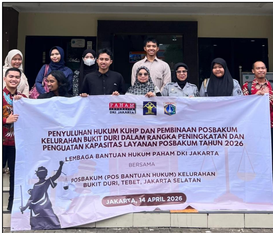
Gambar 5. Sosialisasi dan Penyuluhan Hukum di Kelurahan Bukit Duri Kota Administrasi Jakarta Selatan