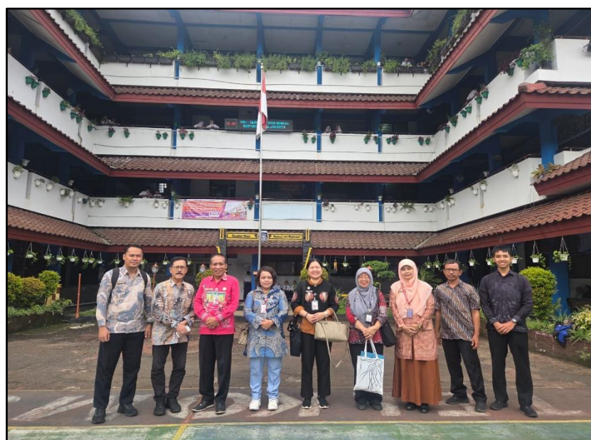
Gambar 4. Sosialisasi dan Penyuluhan Hukum di SMP Negeri 49 Jakarta di Kota Administrasi Jakarta Timur