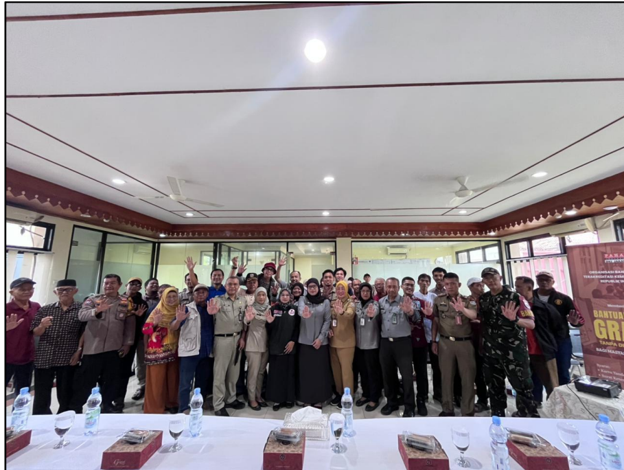
Gambar 5. Sosialisasi dan Penyuluhan Hukum di Kelurahan Bukit Duri Kota Administrasi Jakarta Selatan