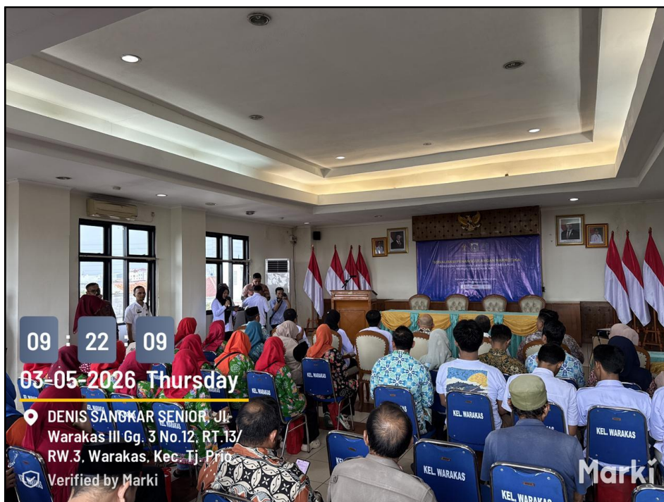
Gambar 2. Sosialisasi dan Penyuluhan Hukum di Kelurahan Warakas Kota Administrasi Jakarta Utara