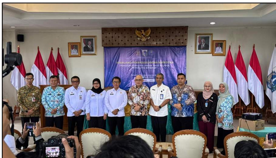
Gambar 1. Sosialisasi dan Penyuluhan Hukum di Kelurahan Warakas Kota Administrasi Jakarta Utara

Kegiatan ini bertujuan untuk memberikan pemahaman dan meningkatkan kesadaran hukum masyarakat mengenai bahaya penyalahgunaan narkoba, pentingnya rehabilitasi bagi pengguna narkoba, serta akses terhadap layanan bantuan hukum yang dapat dimanfaatkan masyarakat. Selain itu kegiatan ini diharapkan dapat mendorong partisipasi aktif masyarakat dalam pencegahan dan penanggulangan penyalahgunaan narkoba sehingga tercipta lingkungan yang aman, sehat, dan bebas dari narkoba di wilayah Kelurahan Warakas.