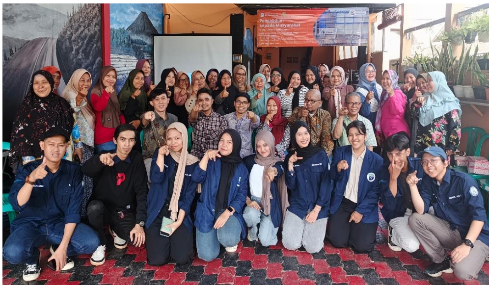
Gambar 4. Tim PKM Bersama Peserta

Indikator keberhasilan kegiatan terlihat dari antusiasme para Ibu-Ibu PKK dalam memperhatikan dan mengerti materi pelatihan dengan aktif saat berpartisipasi