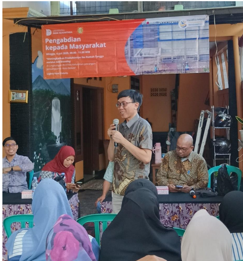
Gambar 3. Pemaparan Etika dan Etiket