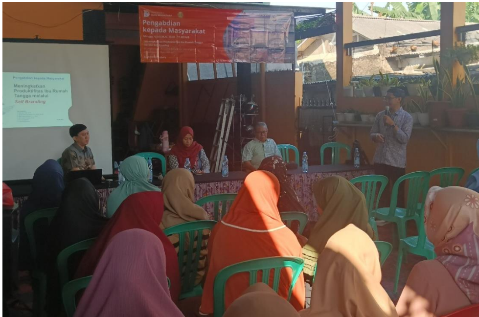
Gambar 2. Pemaparan Personal Branding

membuka ruang partisipasi aktif dan produktif, sekaligus meningkatkan pengakuan sosial terhadap kapasitas individu perempuan di dalam organisasi PKK.