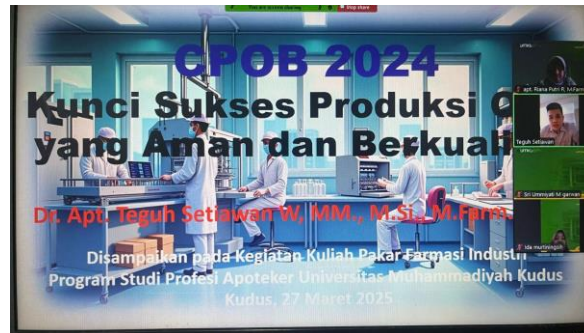
Gambar 1. Penyampaian Materi Oleh Narasumber