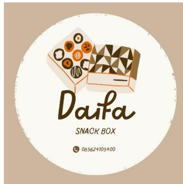
Gambar 5. Logo UMKM Daifa Snack Box

Pembuatan logo adalah suatu proses dalam industri desain yang dilakukan untuk menciptakan identitas visual baru atau memperbaharui yang sudah ada dengan tujuan meningkatkan kualitasnya. Dalam hal ini, pembuatan logo menjadi penting karena kue basah Ibu Oon sebelumnya tidak memiliki logo yang mencerminkan identitasnya dan sekarang berubah namanya menjadi Daifa Snack Box.