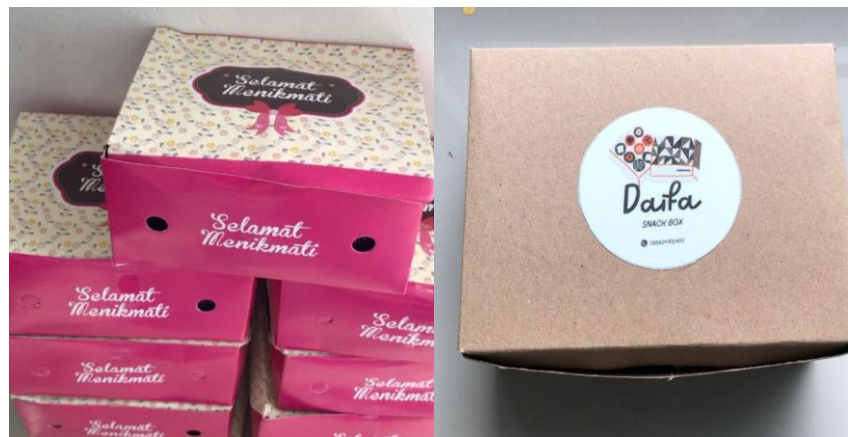
Gambar 7. Packaging sebelum dan sesudah

Packaging (Kemasan) adalah salah satu bagian yang penting pada sebuah produk, karena kemasan sendiri pada dasarnya berfungsi sebagai pelindung seperti yang tertulis pada Kamus Besar Bahasa Indonesia (KBBI). Berbagai macam kemasan dibuat semenarik mungkin, namun ada juga kemasan yang terkadang dibuat seadanya saja (Krasovec, 2016). Kemasan (Packaging) akan bisa berguna dengan optimal apabila didukung dengan perencanaan yang terstruktur baik secara internal maupun eksternal. Untuk itu kemasan harus mampu menyampaikan pesan lewat komunikasi informatif, seperti halnya komunikasi antara penjual dengan pembeli.