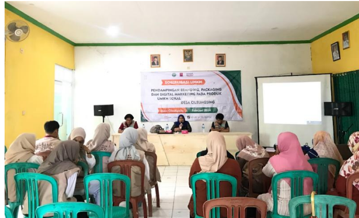
Gambar 1. Sosialisasi di Kantor Desa Cileungsing

memasarkan produk melalui media online seperti Instagram, Tik Tok, Facebook, dan media lain untuk menunjang kemajuan penjualan dan pemasokan pesanan produk UMKM.