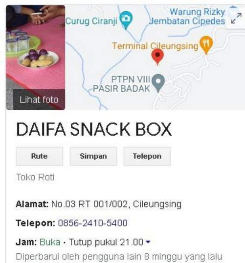
Gambar 9. Data Maps Lokasi UMKM

Dengan Google Maps, UMKM dapat meningkatkan visibilitas mereka secara online, memudahkan pelanggan untuk menemukan lokasi fisik mereka, dan memperluas jangkauan pasar. Ini membuat Google Maps menjadi pilihan utama dalam merealisasikan Sistem Informasi Geografis (SIG) dan memiliki manfaat yang besar bagi berbagai jenis bisnis, baik skala kecil maupun enterprise.