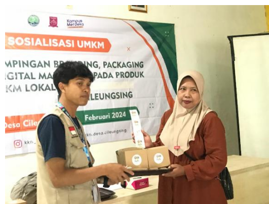
Gambar 8. Penyerahan Logo & Packaging baru kepada Ibu Oon