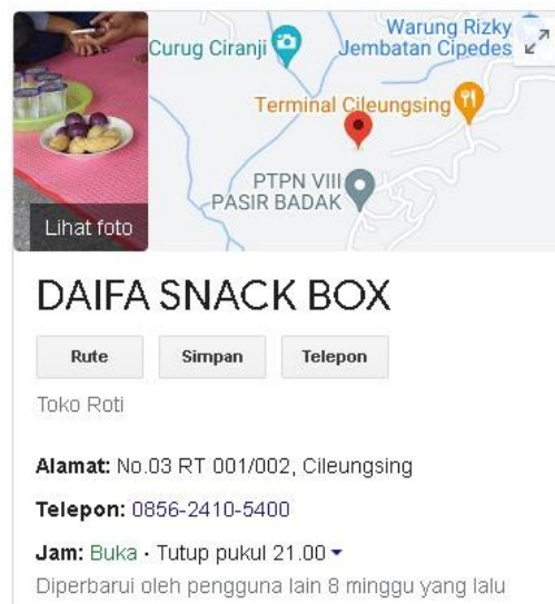
Gambar 9. Data Maps Lokasi UMKM

Dengan Google Maps, UMKM dapat meningkatkan visibilitas mereka secara online, memudahkan pelanggan untuk menemukan lokasi fisik mereka, dan memperluas jangkauan pasar. Ini membuat Google Maps menjadi pilihan utama dalam merealisasikan Sistem Informasi Geografis (SIG) dan memiliki manfaat yang besar bagi berbagai jenis bisnis, baik skala kecil maupun enterprise.