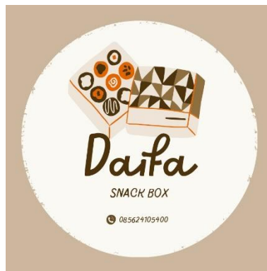
Gambar 5. Logo UMKM Daifa Snack Box

Pembuatan logo adalah suatu proses dalam industri desain yang dilakukan untuk menciptakan identitas visual baru atau memperbaharui yang sudah ada dengan tujuan meningkatkan kualitasnya. Dalam hal ini, pembuatan logo menjadi penting karena kue basah Ibu Oon sebelumnya tidak memiliki logo yang mencerminkan identitasnya dan sekarang berubah namanya menjadi Daifa Snack Box.