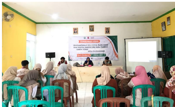
Gambar 1. Sosialisasi di Kantor Desa Cileungsing

memasarkan produk melalui media online seperti Instagram, Tik Tok, Facebook, dan media lain untuk menunjang kemajuan penjualan dan pemasokan pesanan produk UMKM.