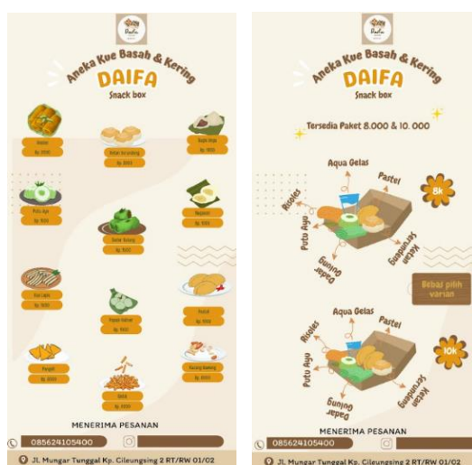
Gambar 4. Poster Harga Menu