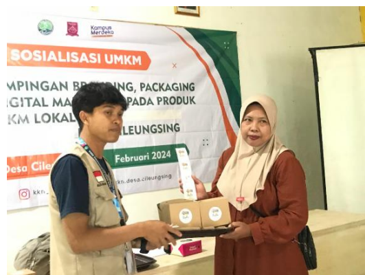
Gambar 8. Penyerahan Logo & Packaging baru kepada Ibu Oon