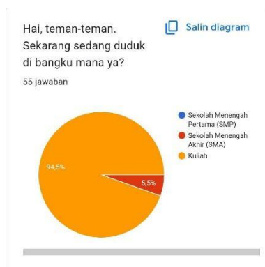
Gambar 1. Jenjang Pendidikan Responden

Hasil dari pengumpulan data kuesioner disajikan dalam bentuk diagram beserta penjelasannya.