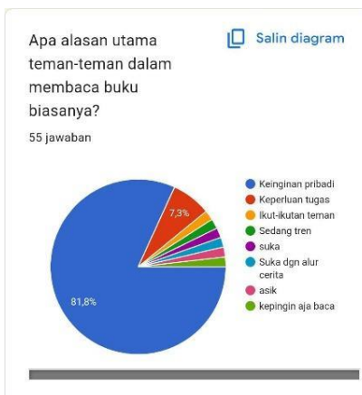
Gambar 8. Faktor Utama Remaja Ketika Membaca Buku

Jumlah buku (novel/buku ilmiah/buku self-improvement/lainya) yang dipunya responden adalah 34,5% mempunyai koleksi lebih dari 5 buku, 32,7% responden mempunyai 3-5 buku, dan 32,7 sisanya mempunyai 1-3 buku.