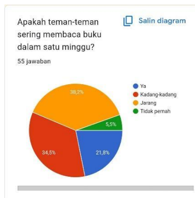
Gambar 9. Tingkat Intensitas Remaja Membaca Buku Dalam Satu Minggu

Alasan utama responden tertarik untuk membaca buku yaitu dari hasil jawaban menunjukkan bahwa 81,1% karena keinginan pribadi, 7,3% karena keperluan tugas, dan sisanya ikut-ikutan teman, sedang tren, suka dengan alur ceritanya, dan lain sebagainya.