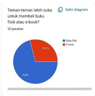
Gambar 3. Jenis Buku Yang Digemari Remaja

Pertanyaan mengenai seberapa sering responden melakukan pembelian buku, hasil dari survei menunjukkan dengan hasil responden 45,5% tidak sering, 34,5% terkadang, dan 16,4% setuju bahwa mereka sering membeli buku, dan sisanya 3,6% menjawab tidak pernah membeli buku.