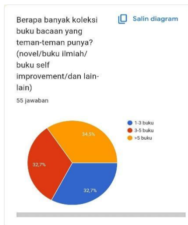
Gambar 7. Jumlah Koleksi Buku Para Remaja

Hasil survei menunjukkan bahwa genre yang menarik untuk dibaca di kalangan remaja yaitu 69,1% lebih tertarik pada genre fiksi, 16,4% tertarik pada buku self-improvement, dan sisanya tertarik pada genre olahraga dan komik.