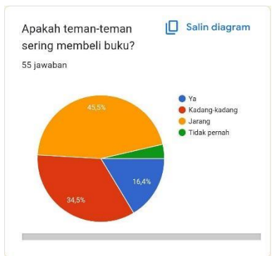
Gambar 2. Tingkat Keseringan Remaja Membeli Sebuah Buku

Pertanyaan mengenai seberapa sering responden melakukan pembelian buku, hasil dari survei menunjukkan dengan hasil responden 45,5% tidak sering, 34,5% terkadang, dan 16,4% setuju bahwa mereka sering membeli buku, dan sisanya 3,6% menjawab tidak pernah membeli buku.